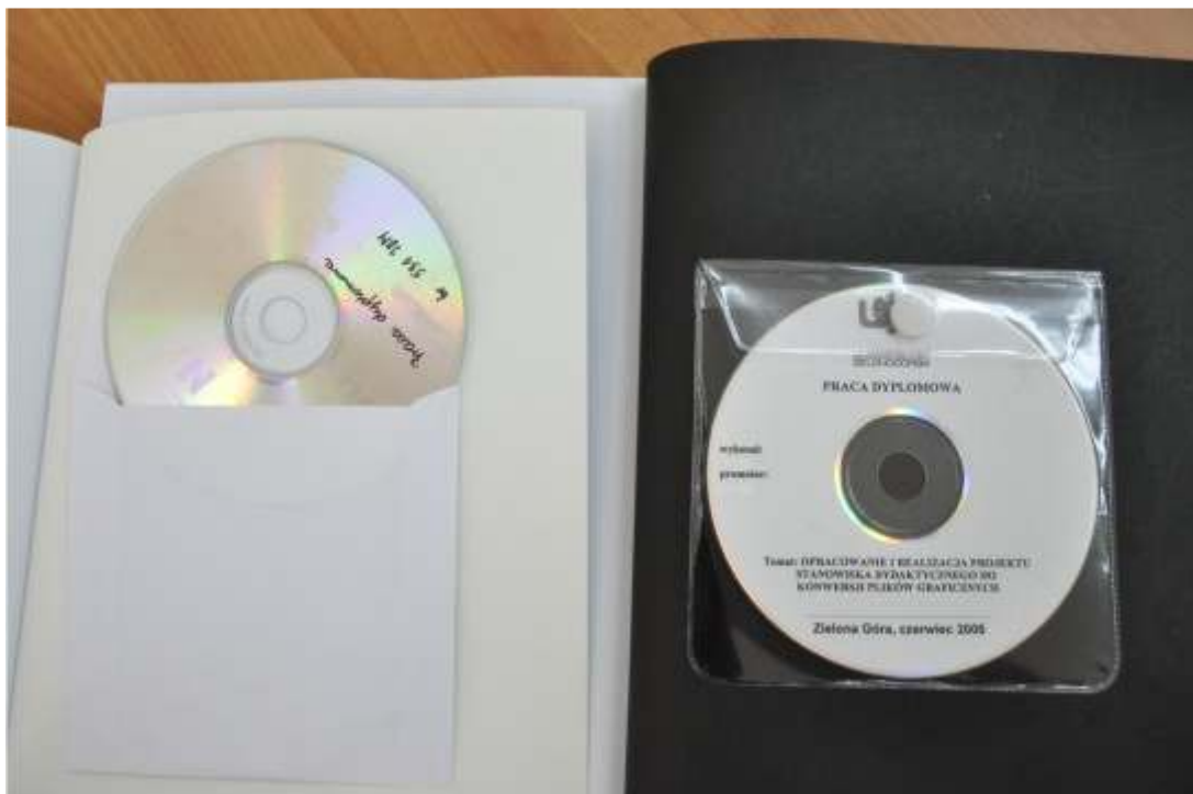
Rysunek 2. Zalecana forma umocowania płyt CD/DVD – przykłady.